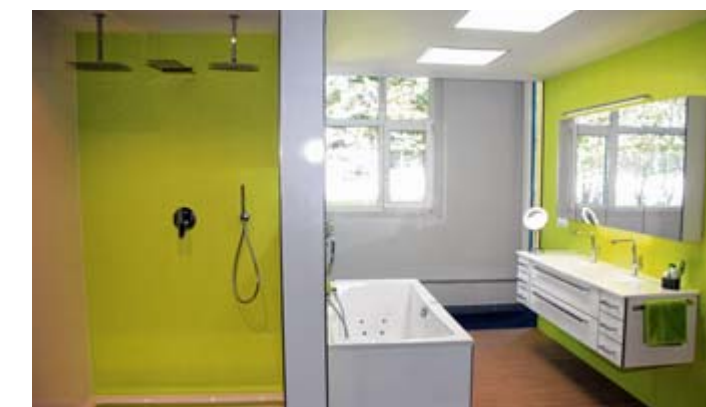
Dieses in grünen Farben gehaltene „Freshbad“ eignet sich insbesondere für das moderne Wohnen für junge und junggelebene Menschen.