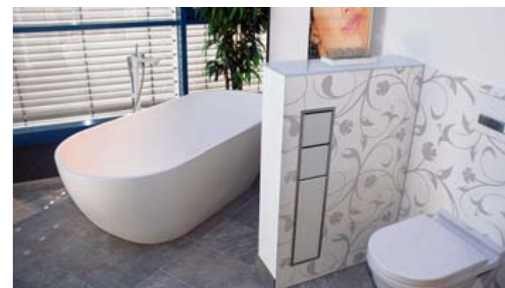
Zu sehen in der neuen Ausstellung bei Bommer: Ein Sommerbad mit hellen und aufgelockerten Farben.

Bommer GmbH - DIE BADGESTALTER Rengoldshäuserstr.12 - 88662 Überlingen