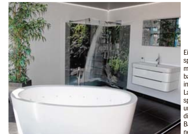
Eine Lackspanndecke mit unsichtbaren integrierten Lautsprechern umgibt diese Badewanne.